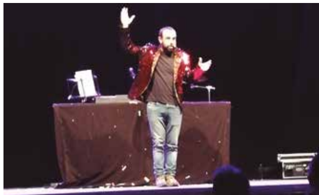
Sant Jaume