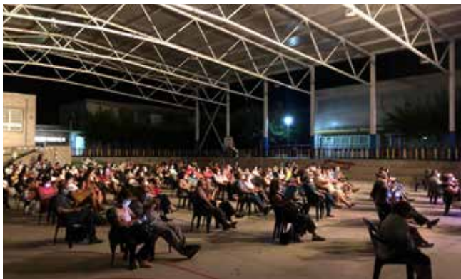
Sant Jaume

Malgrat la situació d'anormalitat, la Comissió de Festes de Sant Jaume i les Societats del Papiolet i de la Torregassa han fet un gran esforç per organitzar les Festes Majors que hem celebrat aquest estiu. Ha calgut adaptar les celebracions per tal de respectar les mesures i indicacions de les autoritats sanitàries. Es va establir limitació en l'aforament i control d'accés en aquelles activitats que així ho aconsellaven, tot i això, molta gent va sortir al carrer per participar-hi i gaudir de les merescudes festes després de setmanes de confinament i de contenció.