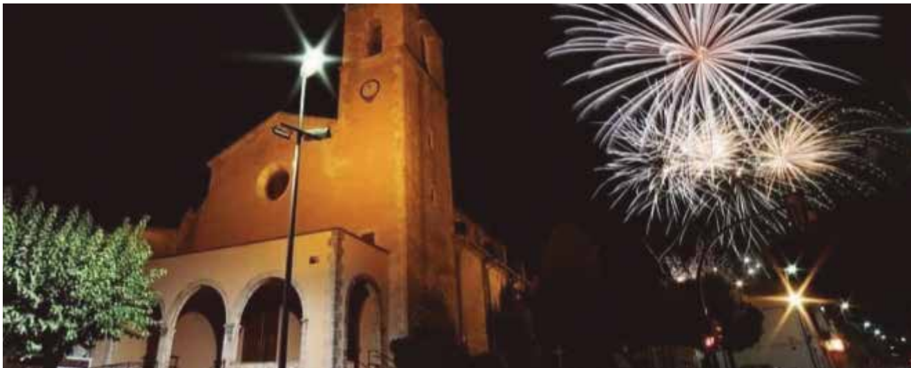
Sant Jaume

Per endavant ens queda la de Lletger, a l'octubre, quan esperem que tot hagi millorat i puguem permetre'ns més alegries.