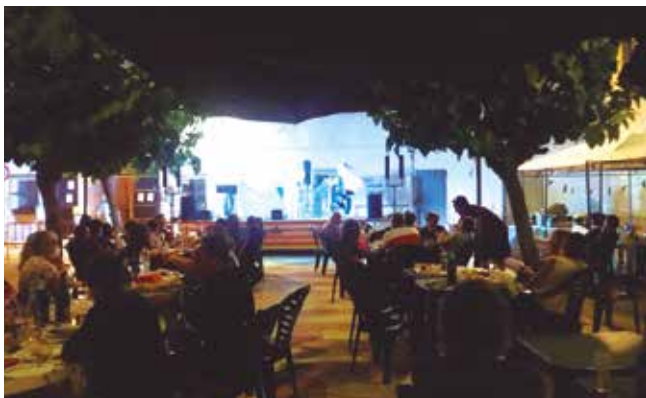
El Papiolet