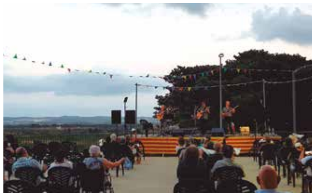
La Torregassa